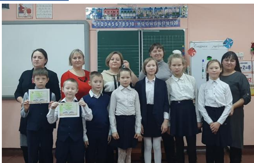
Участники секции №1/1 «Исследовательский проект»