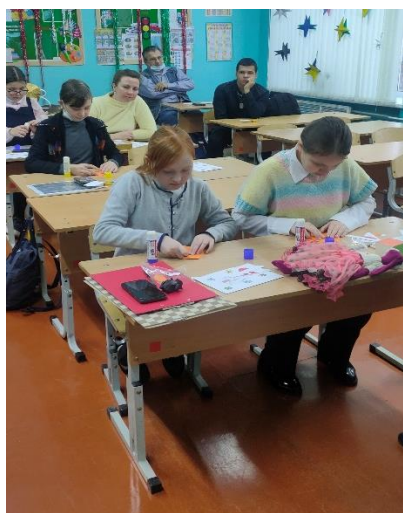
Проект «Оригами» Мастер-класс по изготовлению закладки «Тигренок»

Подводя итог, можно сказать, что, безусловно, проектная деятельность оказывает положительное влияние на развитие, воспитание детей с ОВЗ. Дети, которые боялись отвечать даже на уроке, смогли выступить с рассказом проекта перед учащимися другого класса.