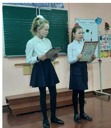
Проект «Режим дня обучающихся 4 класса»